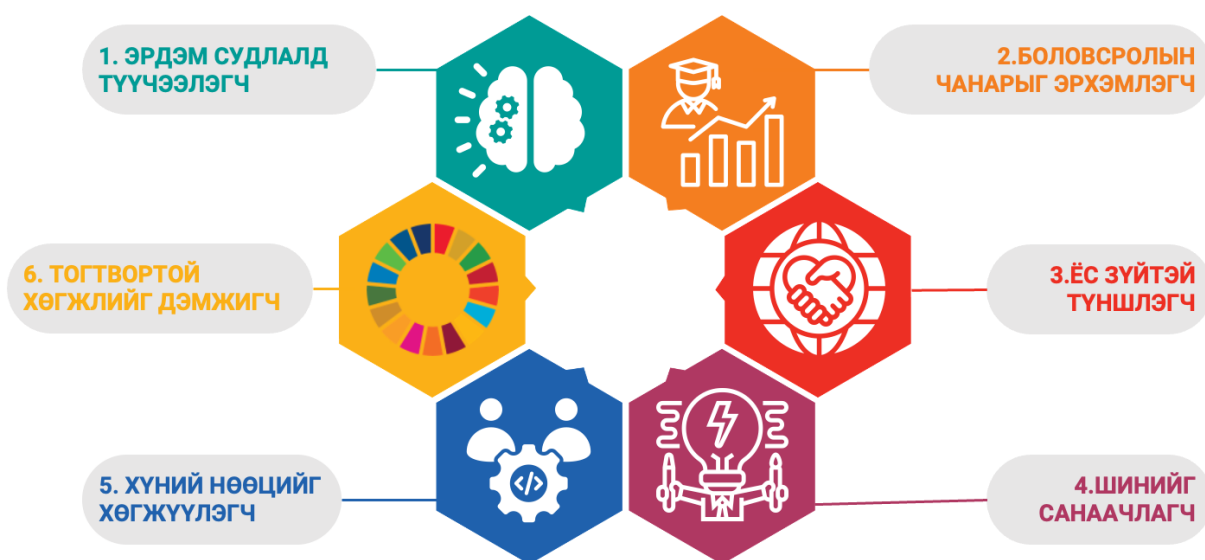
Зураг 3. БСҮХ-ийн зорилго

Стратегийн зорилгын хүрээнд тодорхойлсон 18 зорилтыг хэрэгжүүлэх гол үйл ажиллагааг энэхүү төлөвлөгөөний “Стратеги төлөвлөгөөг хэрэгжүүлэх үйл ажиллагаа, хүрэх үр дүн” хэсэгт авч үзсэн болно.