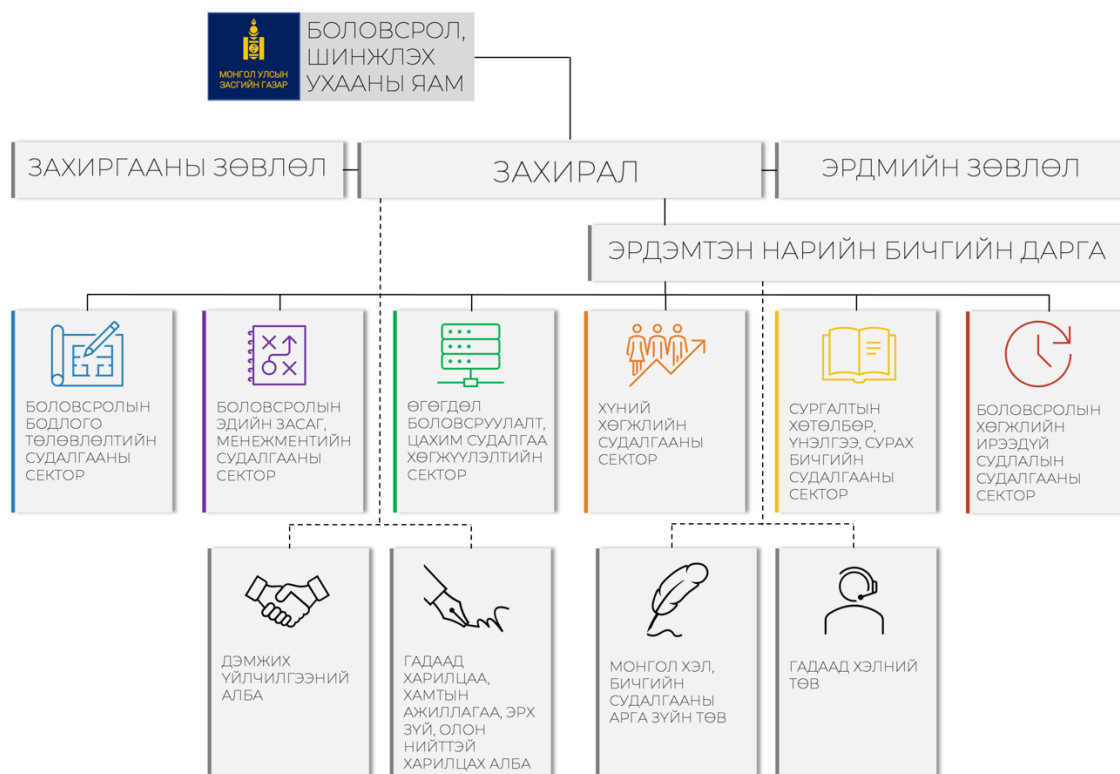
Зураг 1. БСҮХ-ийн бүтэц

Тус хүрээлэн Боловсролын ерөнхий хуулийн 1 17.2-т заасан “... боловсролын бодлогын суурь, хавсарга судалгаа, шинжилгээ, инновац, арга зүйн болон сургалт эрхлэх чиг үүргийн хэрэгжүүлнэ”. Мөн Сургуулийн өмнөх болон ерөнхий боловсролын тухай хуулийн 2 10.4-т зааснаар тухайн хуулийн 7.3, 10.2, 10.3, 10.10-т заасан сургалтын хөтөлбөр, ерөнхий боловсролын сургалтын төлөвлөгөө, мөн Боловсролын ерөнхий хуулийн 14.8-д заасан цахим сургалтын хөтөлбөрийг боловсруулах чиг үүрэгтэй болно.